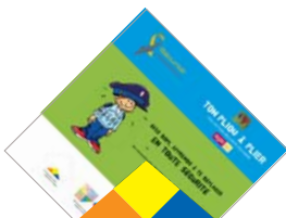
1 / Votre pliou à plat, Rabattre les 4 angles