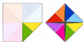
2 / Retourner le Plioui, Rabattre à nouveau les 4 angles