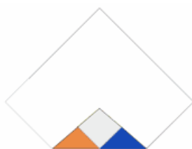
1 / Ton Plioui à plat et retourné. Rabattre les 4 angles