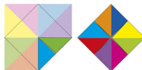
2 / Retourner le pliou, Rabattre à nouveau les 4 angles