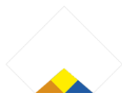
1 / Votre pliou à plat, Rabattre les 4 angles

Pour toute utilisation d'un Pliou dans un cadre professionnel, commercial ou autre, merci de contacter notre équipe commerciale contact@pliou.net ou en vous connectant à la rubrique PRO de www.pliou.net . Plus d'information sur les mentions légales et conditions générales : www.pliou.net