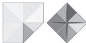
2 / Retourner le Pliou. Rabattre à nouveau les 4 angles