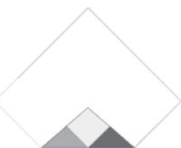
1 / Ton Pliou à plat et retourné. Rabattre les 4 angles.